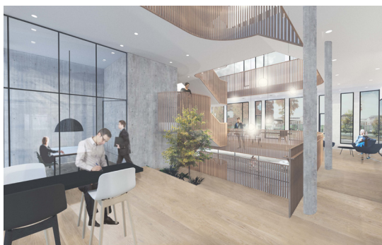
1. og 2. sal indrettes primært til kontorarbejdspladser, mens 3. sal rummer et stort multirum. Visualisering: H+ Arkitekter A/S

Teknisk ingeniørbistand vedr. tekniske installationer, VVS, EL, brand, CTS i alle faser, som underrådgiver til AB Clausen. Endvidere DGNB-ydelser, herunder DGNB Auditor.