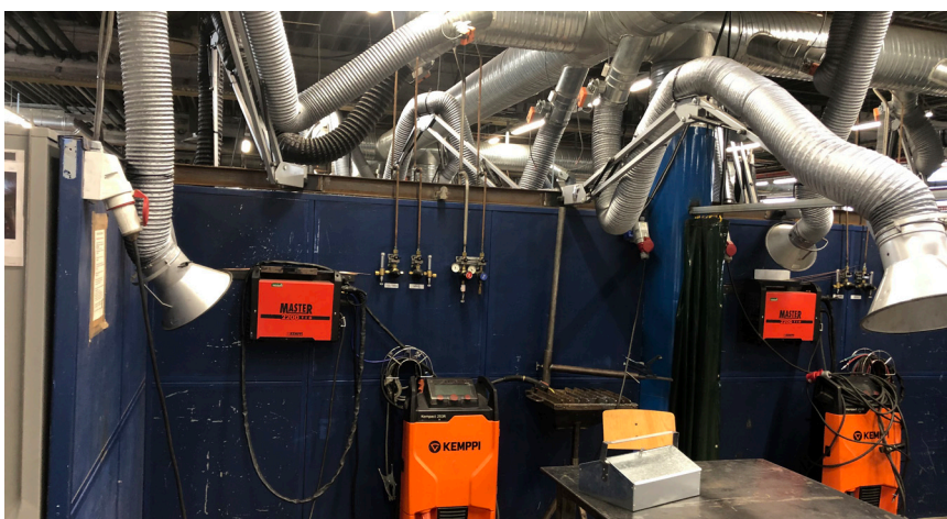
Tv. registrering af de eksisterende værksteder. En del af de større maskiner flyttes og genanvendes i de nye lokaler. Nederst th nye faciliteter.